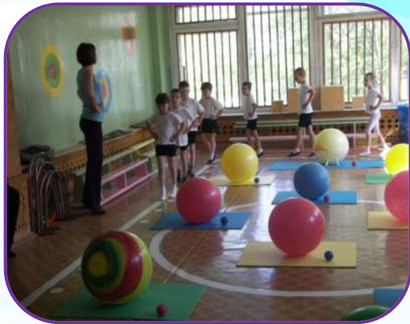
Ходьба на носках